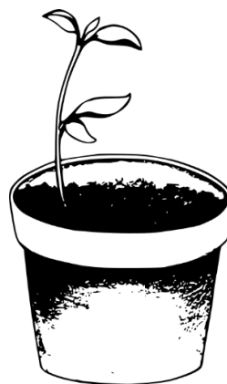
Obrázek 3 Sazenice rajčete

Důvody pro testování více vzorků uvádím proto, aby bylo jasné: a) že jsem nad tím přemýšlela, b) že chci zpřesnit měření a c) že chci předejít poškození vzorků – kdybych to nevyšvětlila, mohl by si někdo myslet, že je mi to buřt a v zahradnictví měli akorát akci 8+1 sazenice zdarma.