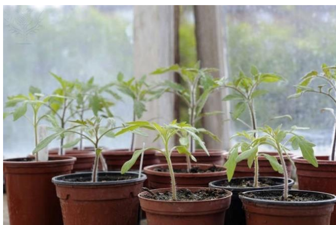
Obrázek 2 Tomato plant, zdroj: Gary K. Smith (2010)

Jednotlivé nádoby jsem označila štítkem s popiskem, aby nedošlo k záměně vzorků. První skupina hnojena žížalím čajem je označena písmenem A, tzn. vzorky A1, A2 a A3. Druhá skupina hojená výluhem ze slepičího trusu je označena písmenem B, tzn. vzorky B1, B2 a B3. Poslední skupina X, tzn. X1, X2 a X3 slouží jako kontrolní a není hnojena vůbec. Cílem kontrolní skupiny je stanovit standard, od kterého se bude odvíjet mé srovnání.