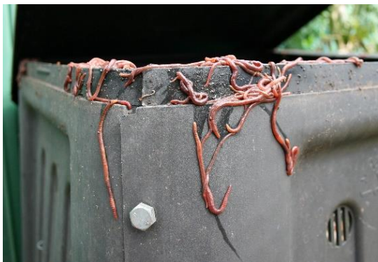
Obrázek 1 Žížala hnojní na kompostéru

Krom kompostu je produktem vermikompostování také tzv. žížalí čaj (worm tea), tekutina, která stéká po stěnách kompostéru do nižších pater nádoby, až do výpustního hrdla odkud se odpouští a následně používá jako kapalné hnojivo (Klupalová, 2016, str. 13). „Bylo pozorováno, že žížalí čaj obsahuje určitou koncentraci rostlinných živin, které, jsou-li používány opatrně, slouží jako prostředek ke kapalnému hnojení“ 3 (García-Gomez, Dendooven a Gutiérrez-Miceli, 2008, str. 360).