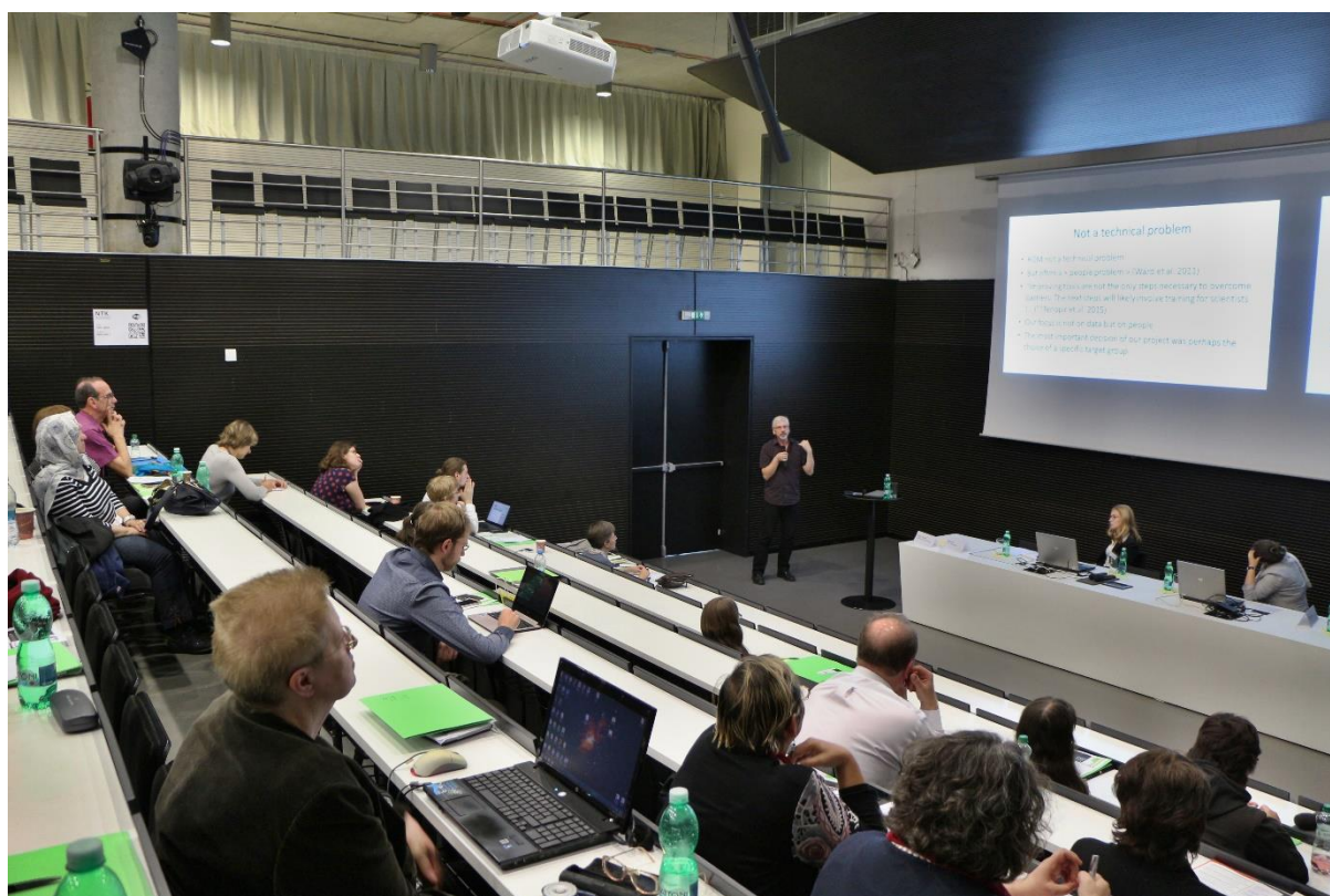
Obr. 3: Konference o šedé literatuře a repozitářích, 2017

Zatím poslední desátá a tedy jubilejní konference proběhla v říjnu 2017. Velká pozornost byla na tomto ročníku konference věnována výzkumným datům a práci s nimi, soustředily se na ně hned tři příspěvky, jak bylo již zmíněno. Oblíbenou stálíci v programu konference jsou prezentace právníků týkající se autorského práva, provozu digitálních repozitářů, osobních údajů nebo veřejných licencí. Přednášející se samozřejmě vrací i ke klasické šedé literatuře, zejména vysokoškolským kvalifikačním pracím a výzkumným publikacím. Konference se zúčastnili hosté z Rakouska, Francie, Slovenska a zcela poprvé přijeli účastníci z Alžíru. Den před konferencí proběhl navíc workshop Výzkumná data a dizertace věnovaný základním otázkám managementu výzkumných dat a možnostem vzdělávání ohledně výzkumných dat pro výzkumníky a studenty na akademické půdě.