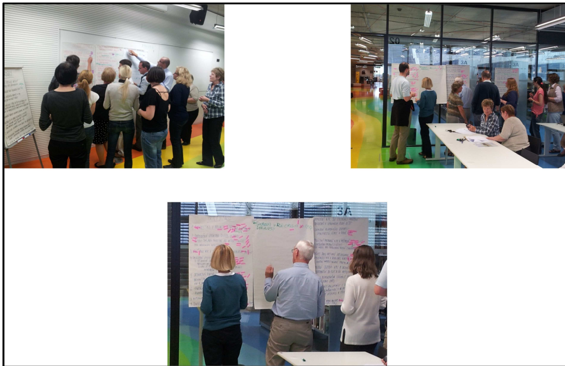
Obrázek 3: Fotodokumentace z realizovaného workshopu

Tento postup je dokumentován na fotodokumentaci z workshopu realizovaného k aktivitě 1.2.2., viz fotografie níže.